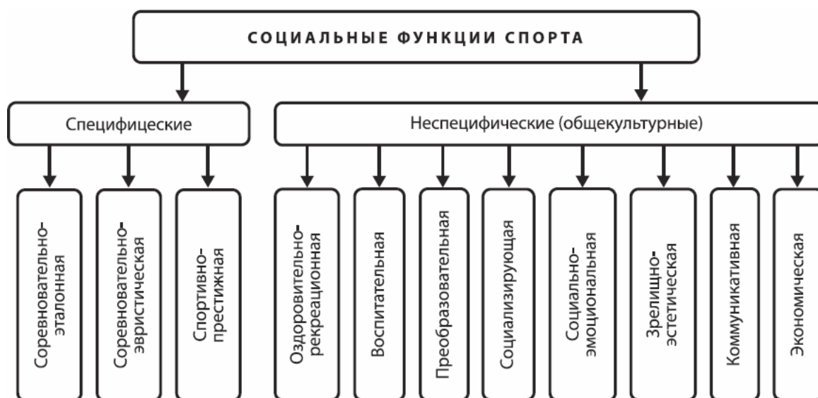
Рис. 1.2. Социальные функции спорта